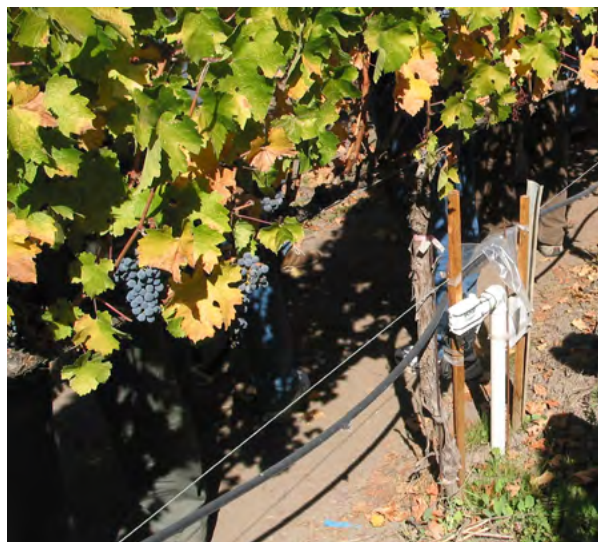
Riego de parras con tubería de goteo.

El riego por goteo suministra agua de manera lenta y uniforme a baja presión a través de mangueras de plástico instaladas dentro o cerca de la zona radicular de las plantas. Es una alternativa a los sistemas de riego por aspersores o surcos.