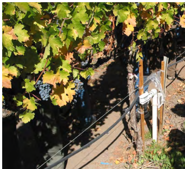
Riego de parras con tubería de goteo.