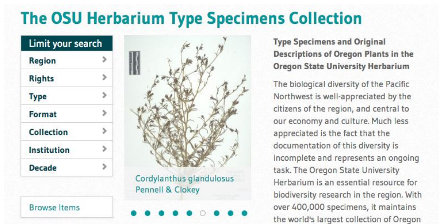
Изображение № 5. Обект от дигиталната колекция на Хербариума на OSU

OSULP осъществява съвместна дейност с Хербариума на OSU за цифровизиране на събраните в неговата сбирка уникални растителни видове от Орегон, както и на оригиналните им описания, публикувани в научни списания за градинарство и ботаника (Изобр. № 5). Учените от Хербариума са заинтересовани от сътрудничество с библиотеката, отчитайки опита на библиотечните специалисти в областта на каталогизацията, стандартизацията и метаданните, както и на компетентността им по отношение на авторското право и достъпа до научно съдържание в съответната научна област.