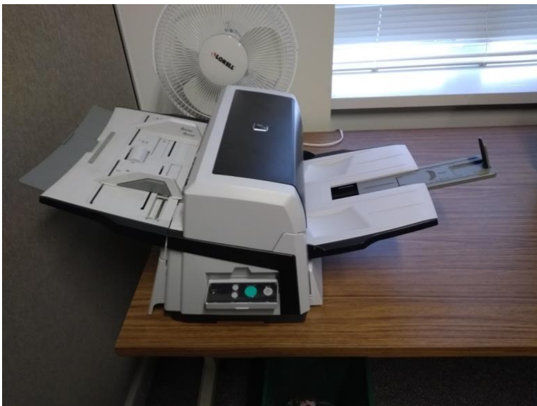
Изображение № 3. Сканиране на текстови ресурси.

OSULP въвежда и програма за видео цифровизация, в рамките на която се дигитализират библиотечни материали като филми и други видеоресурси, които са изложени на висок риск от физическо захабяване и повреждане (Изобр. № 4).