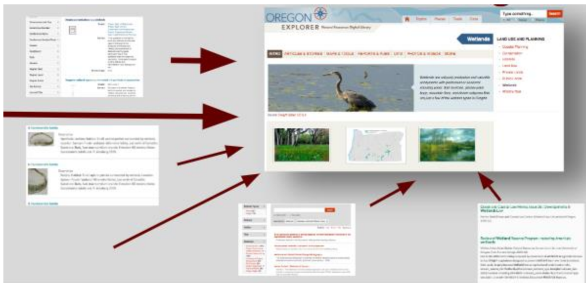
Изображение № 6. Обект от дигиталната библиотека Oregon Explorer