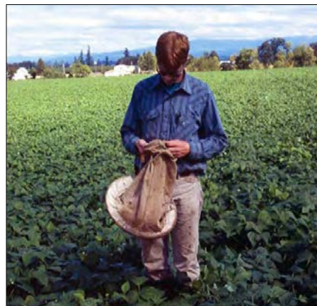
Figure 5. Count the beetles. Use an action threshold of three beetles per ten arcs of the sweep net. (Cuenta los escarabajos. Use un límite de daño de tres escarabajos por cada diez barridas con la red.)