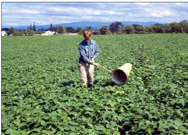
Figure 4. Sweep net sampling (Muestreo usando una red de barrido)